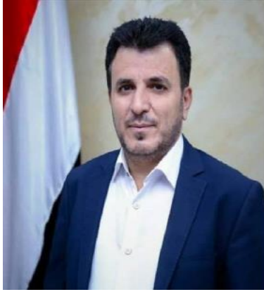
أ.د. طه أحمد المتوكل وزير الصحة

الحمد لله رب العالمين، والصلاة والسلام على سيدنا محمد وعلى آله الطيبين الطاهرين ورضي الله عن أصحابه المنتجبين.