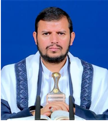
سماحة السيد القائد/ عبدالمك بدر الدين الحوثي

الجانب الصحي وموقعه في كلام سماحة السيد القائد يحفظه الله: