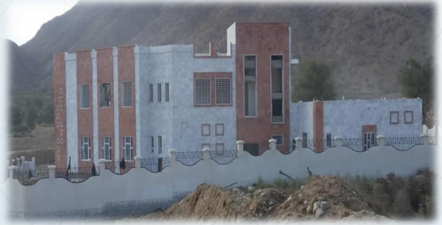
(2) مستشفى رازح الريفي.