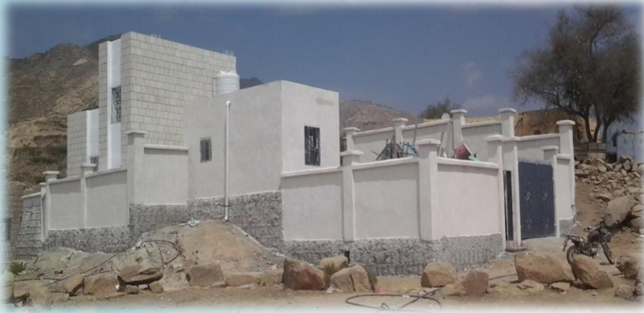
(4) وحدة قرحاؤ - م/ ساقين.