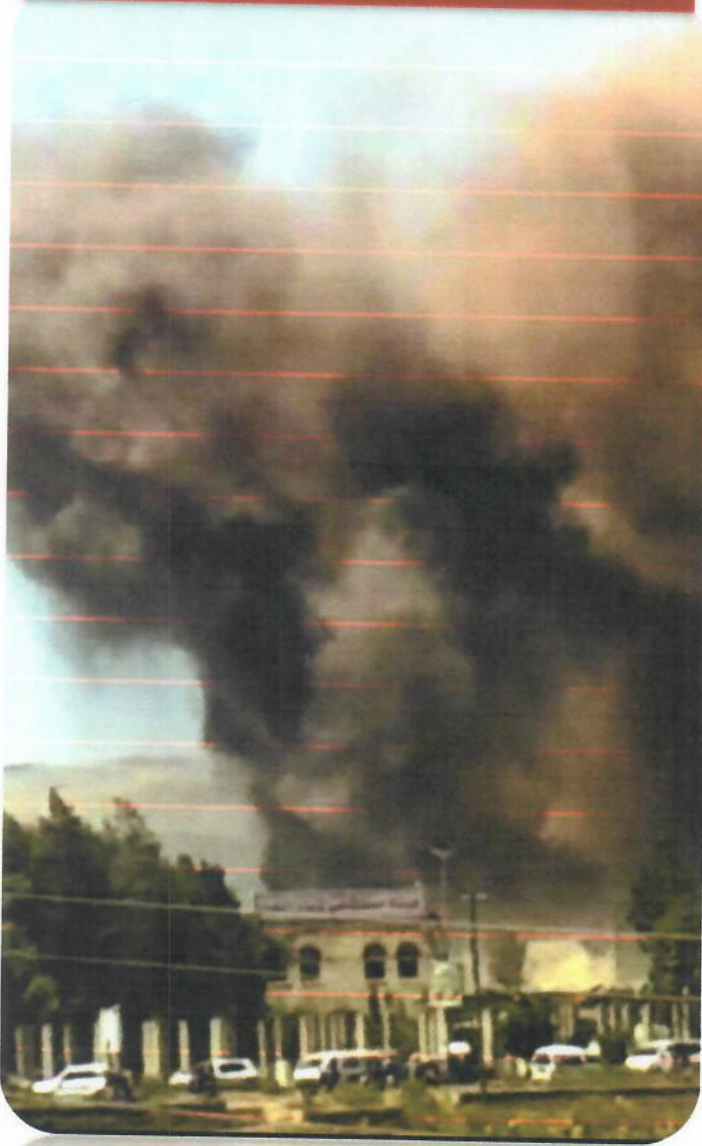
صورة توضيحية للضربة كلها فوق مبني المستشفى